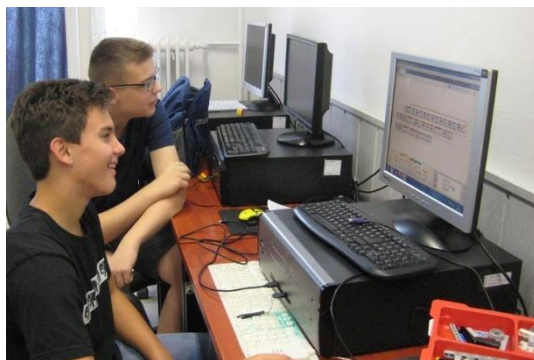
Lego-robot programozás közben

Annak érdekében, hogy az iskolát elhagyó tanulók mindinkább megfeleljenek a modern Európa elvárásainak, kiemelt fontosságúnak tartjuk a szilárd erkölcsi, szellemi értékrendszer kialakításán túl a nyelvoktatást és az információs technológiák alkalmazásának megismertetését. A megfelelő kommunikációs készség megszerzésén kívül mindezzel elsődleges célunk, hogy tanulóinkat olyan tudás birtokába juttassuk, amely megteremti már itt a középiskolában, de még inkább felnőtt életükben annak a lehetőségét, hogy elérhessék a mindenkori legmodernebb információkat az általuk kiválasztott szakterületen. Ezáltal boldogulhatnak majd pályájukon.